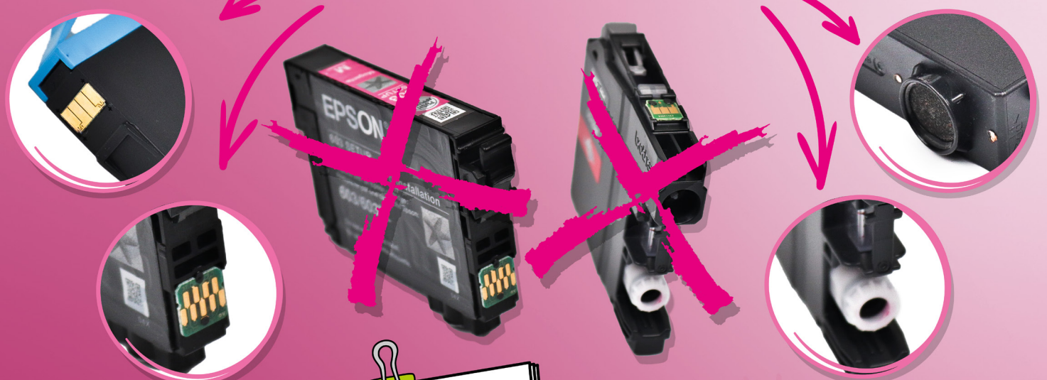
Beispiele für Tintentanks ohne Druckkopf

Besondere Erkennungszeichen: WINZIGER CHIP und LOCH