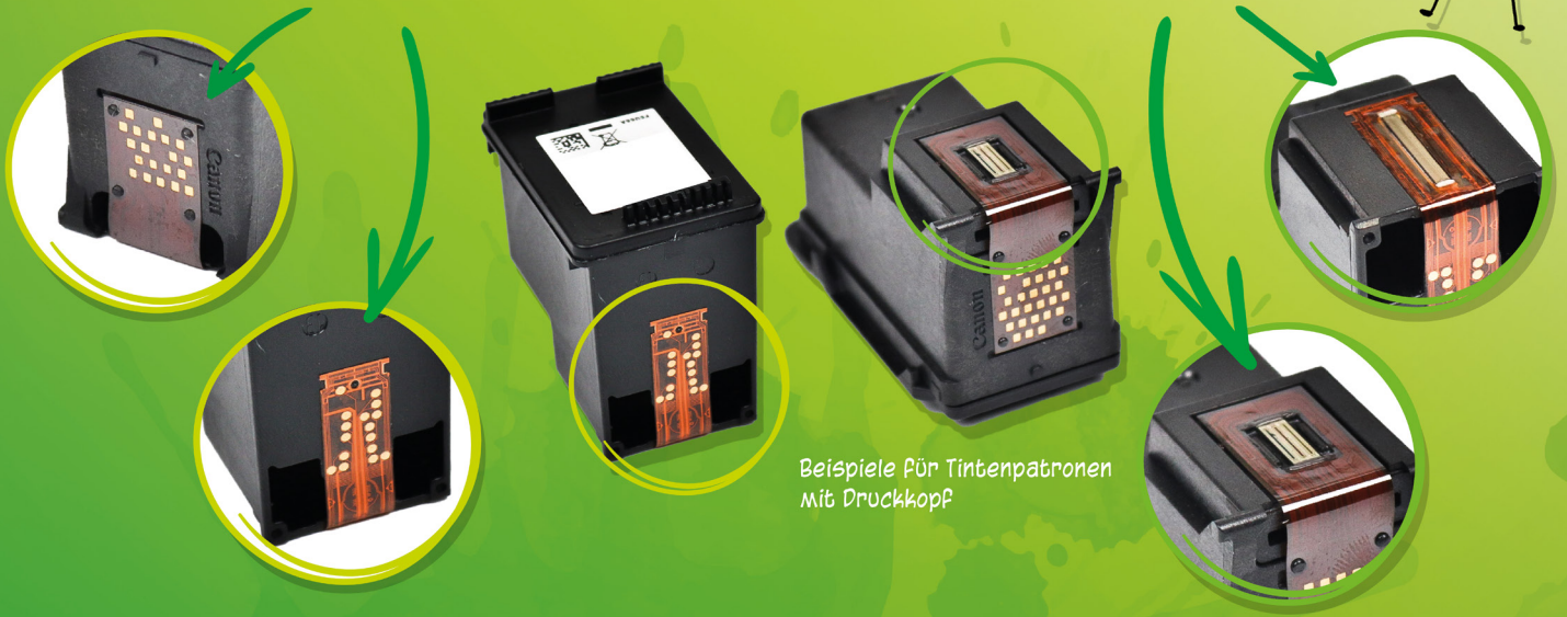
Beispiele für Tintenpatronen mit Druckkopf

Besondere Erkennungszeichen: KUPFERPLATINE und GOLDENER STREIFEN